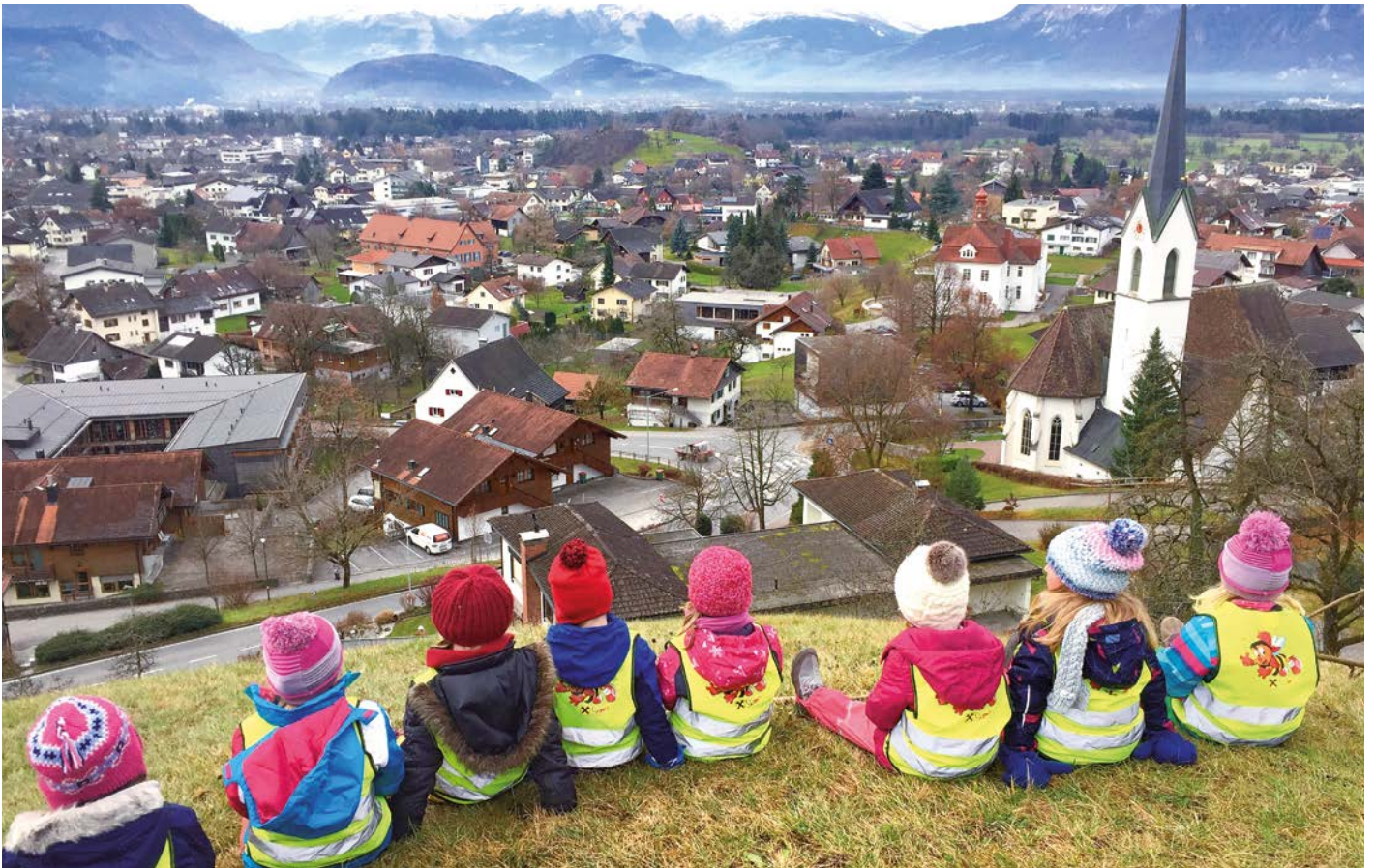
Die Kinder des Kindergartens Röhth genießen den Blick über Röhth vom Guggerbühel aus.