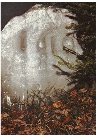
Grenzstein der Scheidgrenze zwi- schen Röthis und Viktorsberg, Jahreszahl 1610.