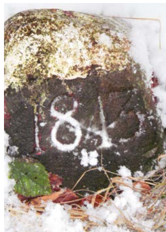
Grenzstein Röthis Viktors- berg mit Jahreszahl 1843.