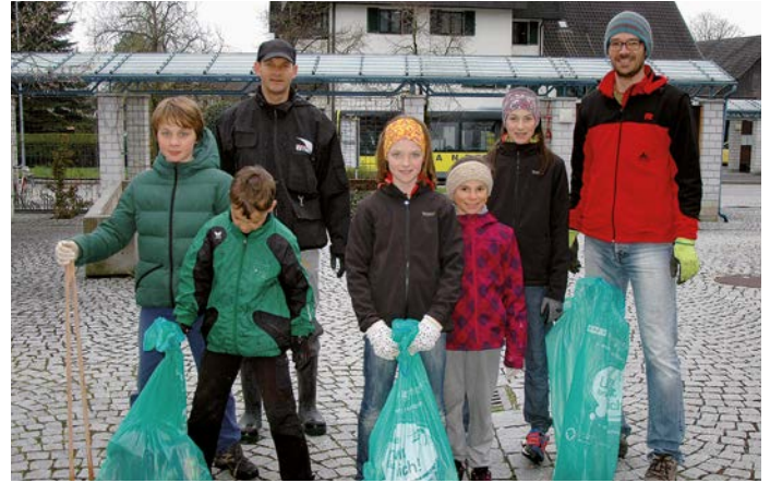
Jung und Alt halfen mit bei der Landschaftsreinigung 2016

Sei dabei bei der Landschaftsreinigung am 25. März 2017. Treffpunkt ist um 9.00 Uhr beim Vereinshaus.