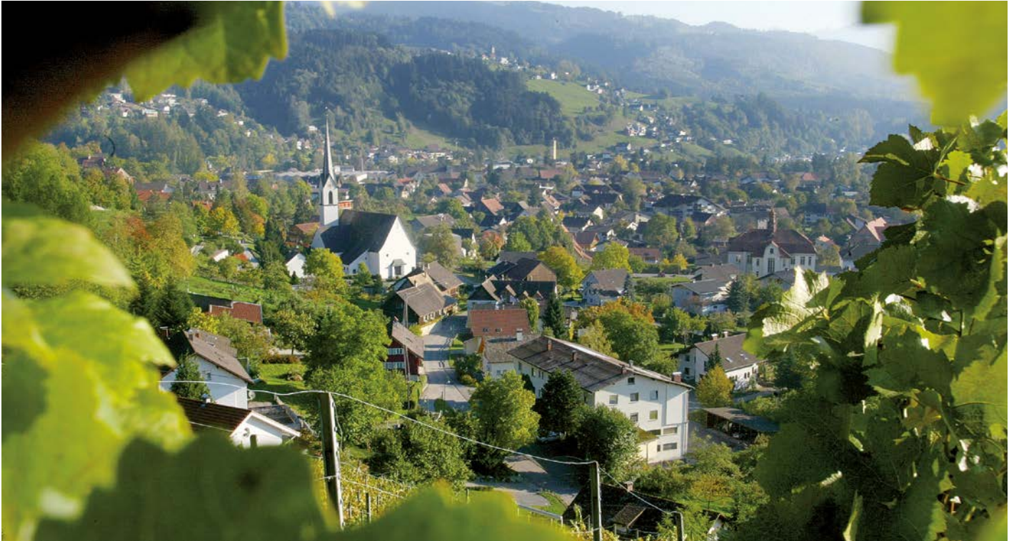
Blick vom Weinberg der Familie Nachbaur auf Röhthi

Seit der Gemeindevertretungswahl im März 2015 sind fast zwei Jahre vergangen. Dies war für die Mitglieder und Ersatzmitglieder der Röhthner Gemeindevertretung, die in den verschiedensten Ausschüssen mitarbeiten, Anlass, sich einen Abend Zeit zu nehmen und unter fachkundiger Anleitung ihre Arbeit für die Gemeinde zu reflektieren.